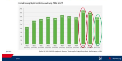
TÄGLICHE INTERNETNUTZUNG IN MIN. NACH DER PANDEMIE

Medienverhalten. Soziale Medien – Spiele: Sexualisierte Inhalte, Gewalt, Exzessiver Konsum